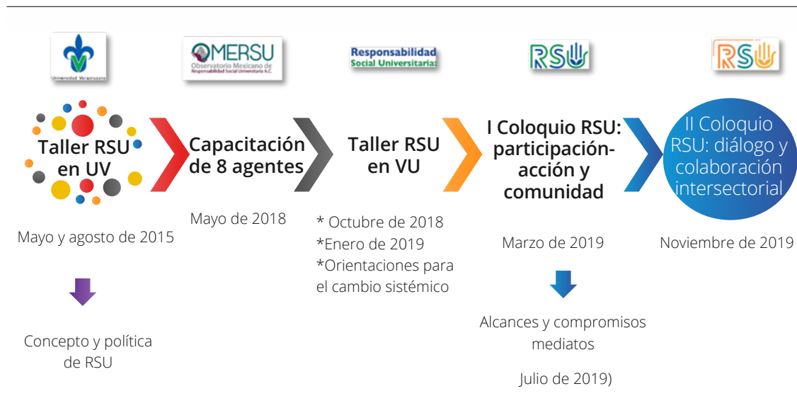
Figura 1. Línea de tiempo de las actividades realizadas al interior de la UV para la RSU.