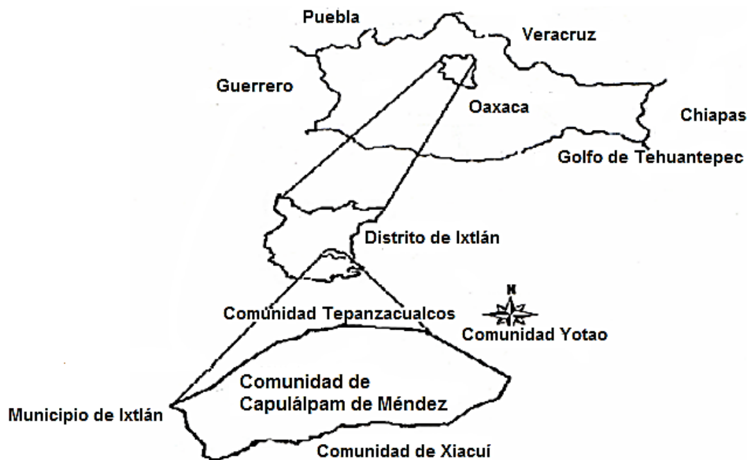
Figura 1. Localización de la Comunidad de Capulálpam de Méndez, Oaxaca

El suelo de clasificación cambisol presenta horizontes bien definidos cuyo horizonte B es argílico, se localiza en mayor proporción en áreas de lome-